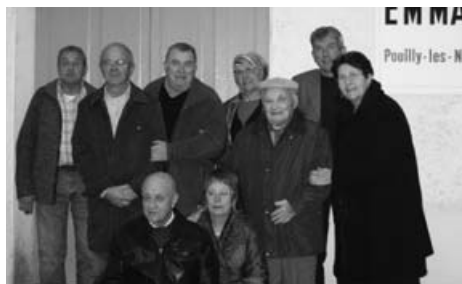
le 24 octobre 2007 avec les bénévoles de l'association St Louis, après les travaux de rénovation de notre dépôt Emmaüs

Les membres de l'A.E.P. Saint Louis et les bénévoles du dépôt Emmaüs de Pouilly les Nonains.