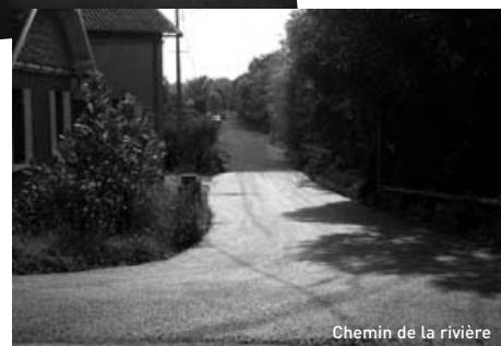
Chemin de la rivière