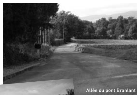
Allée du pont Branlant

Sur la route de Roanne à Renaison (RD9) entre Saint Léger sur Roanne et l'ancien café de la Bûche, et sur la route de Saint Romain (RD18) entre l'allée du stade et la route de la Bûche, vous êtes maintenant en agglomération. Sur ces nouvelles sections, la vitesse est limitée à 70 km/h. Ce changement, nécessaire pour préparer l'arrivée du futur giratoire, renforcera la visibilité de Pouilly les Nonains.