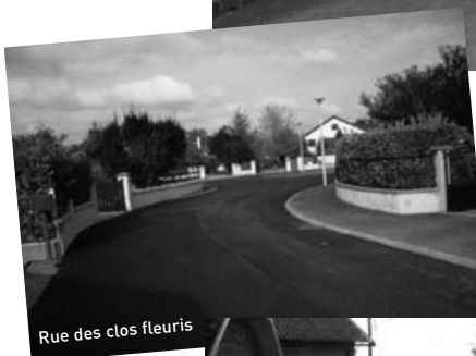
Rue des clos fleuris