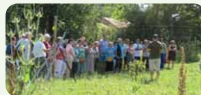
Visite des jardins