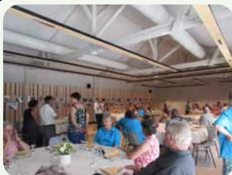
Les retrouvailles avec Montgivray