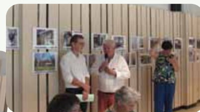
Discours des maires