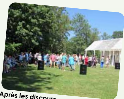
Après les discours, le verre de l'amitié en musique