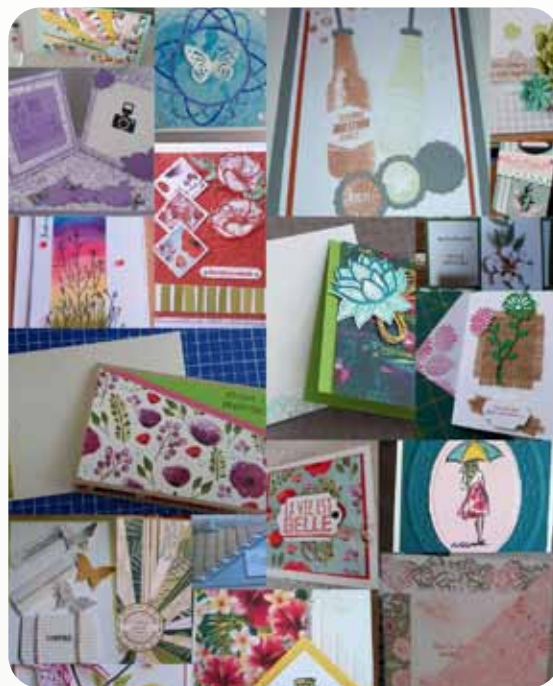
Quelques cartes réalisées lors du 1 er confinement de 2020.

Au cours de cet agréable après-midi nous avons fait un échange de swaps... petits cadeaux avec un tirage au sort original.