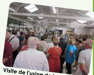
Visite de l'usine de la Fabrikaté