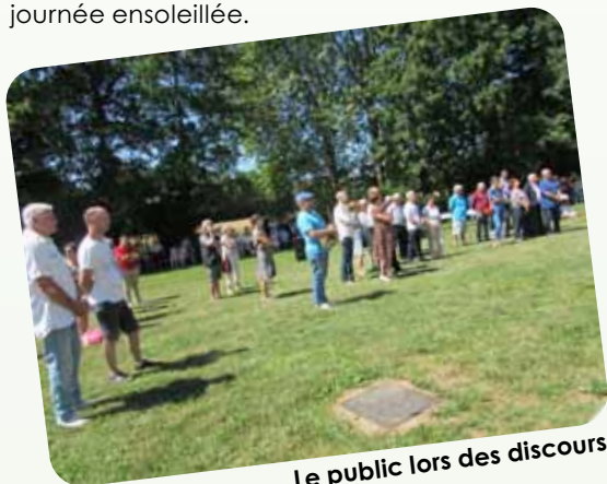
Le public lors des discours