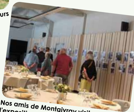
Nos amis de Montgivray visitent l'exposition