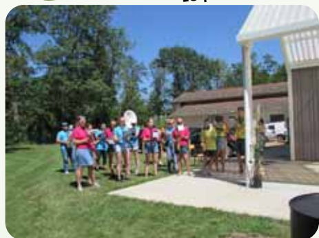
L'harmonie de Saint-Germain-Lespinnasse