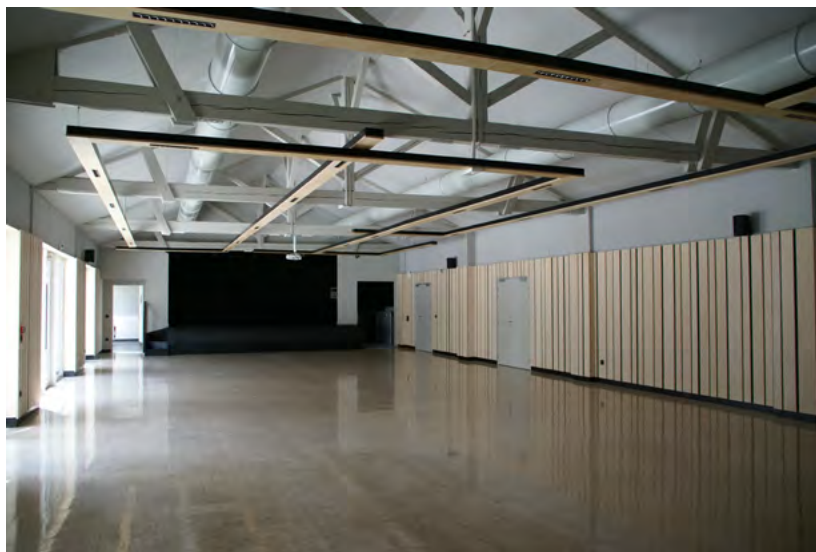
Vue de la scène

Dans sa continuité, un espace entièrement vitré offre son beau volume et sa transparence. Nous pénétrons dans la salle de spectacle, d'amples dimensions et comportant une scène surélevée de quelques marches, à laquelle des personnes à mobilité réduite peuvent accéder grâce à son monte-personne.