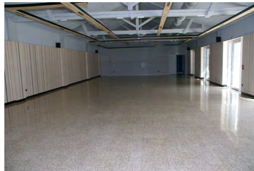
Vue de l'entrée

150 personnes tables rondes de 10 couverts